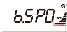
Le graphe indique la vitesse de la soufflerie